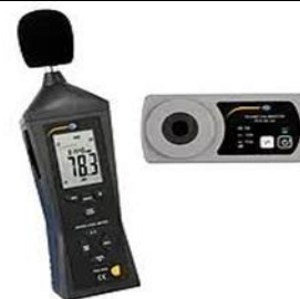
Analyseur de bruit et paramètres climatiques (bruit, lumière, vitesse, température et humidité relative)