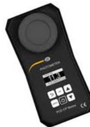
Analyseur d'eau multiparamètres (PH,acide cyanurique, brome, fer, iode, chlore, cuivre, phosphate, fer, nitrate,nitrite,potassium , urée)