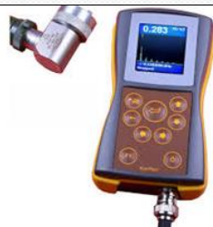
Analyseur de vibration