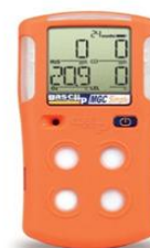
Détecteur de gaz (CO, H2O, SO2, NH3)